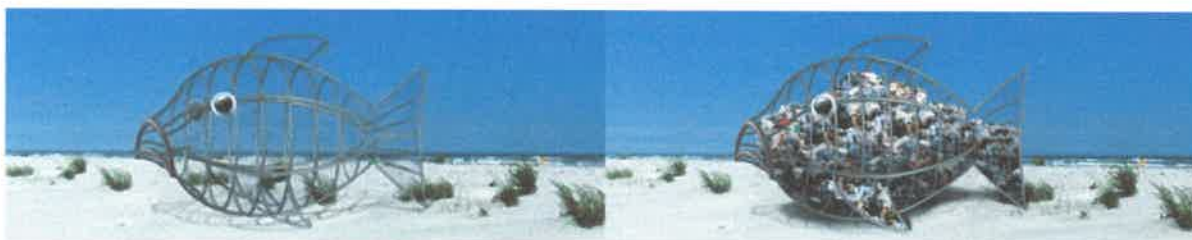
fig. 2 & 3

Fixarea obiectului la sol se realizeaza cu ajutorul cablurilor metalice care fac legatura intre obiect si cuiele cu inel pentru cort. Cuiele cu inel pentru cort pot fi plantate in cilindri de beton de aproximativ 50 cm diametru si inaltime de cca. 15 cm, pentru a asigura contragreutatea necesara fixarii obiectului la sol. (Cilindri de beton pot fi ingropati in nisip din ratiuni estetice). Legaturile dintre cabluri, obiect si cuiele cu inel pentru cort pot fi realizate prin diverse tipuri de carabine care pot permite desprinderea cu usurinta a obiectului si transportarea acestuia in alte locuri. Pentru ancorarea obiectului sunt suficiente 6 puncte de fixare la sol.