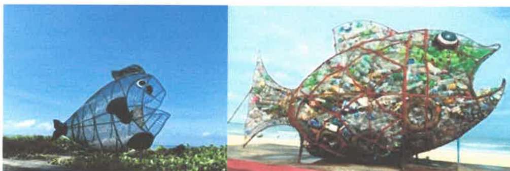
Fig. 1 & 2