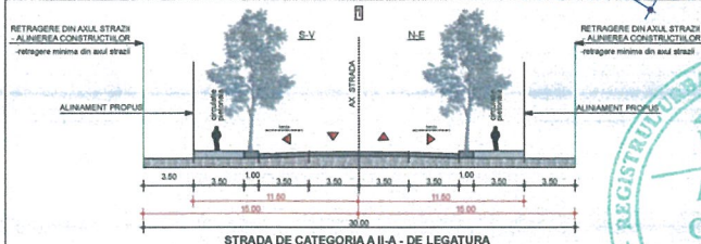
PROFIL CARACTERISTIC AL STRAZII

U.T.R. - Lcl - IS P.O.T. MAX. ADMIS = 35,00 % C.U.T. MAX. ADMIS = 4,00 R h MAX. ADMIS = S+P+11 - 43,00 m